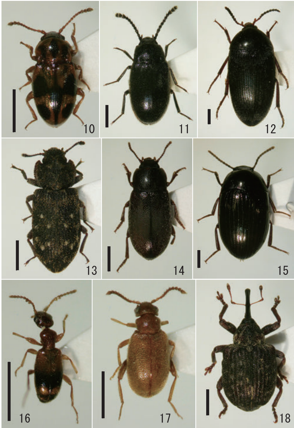
図 1. 山口県で採集した甲虫類 (2)

10. イツホシテントウダマシ； 11. クロコキノコムシダマシ； 12. カツオガタナガクチキ； 13. ホソマダラホソカタムシ； 14. ホソハマベゴミムシダマシ； 15. マルツヤニジゴミムシダマシ； 16. ヒゲブトホソアリモドキ； 17. ニセクビボソムシの一種； 18. タマゾウムシの一種 ※スケールは 1mm.