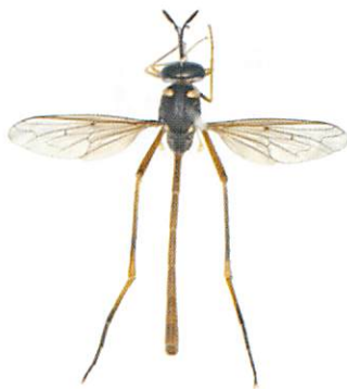
図1 台湾ハラボソツリアブ♂ 背面

宇部市藤曲 向山, 1ex., 5. x. 1958, 田中馨採集; 阿武郡川上村野戸呂, 1ex., 2. ix. 1962, 田中馨採集; 山口市阿東徳佐 十種ヶ峰, 1ex., 28. viii. 1977, 田中馨採集; 山口市徳地柚木滑, 1ex., 28. ix. 1995, 田中馨採集; 岩国市錦町 木谷峽, 5exs., 8. ix. 2002, 田中伸一採集; 岩国市錦町 河津峽, 2exs., 6. ix. 2003, 椋木博昭採集。